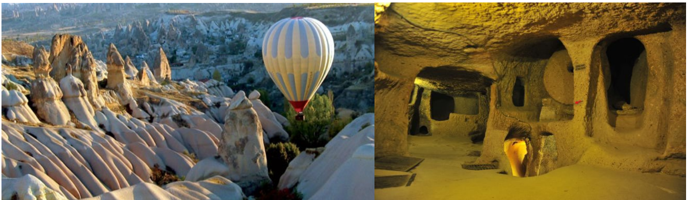
行車距離：全日景區導覽

※ 熱氣球自費活動 ：( 全程時間約 3 小時 ) 觀賞卡帕多奇亞奇特的風化自然地形，最美的方式就是乘熱氣球自空中俯瞰。熱氣球飛行時間約一小時，清晨時分就必須從飯店出發，搭乘熱氣球前會提供茶點，降落後會提供香檳酒慶祝，並領到駕駛員親筆簽名的證書。