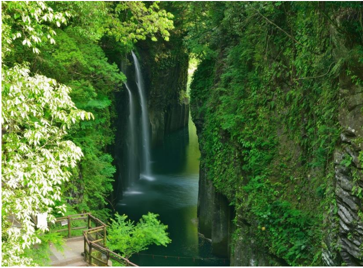
天孫誕生地~神秘高千穗峽谷