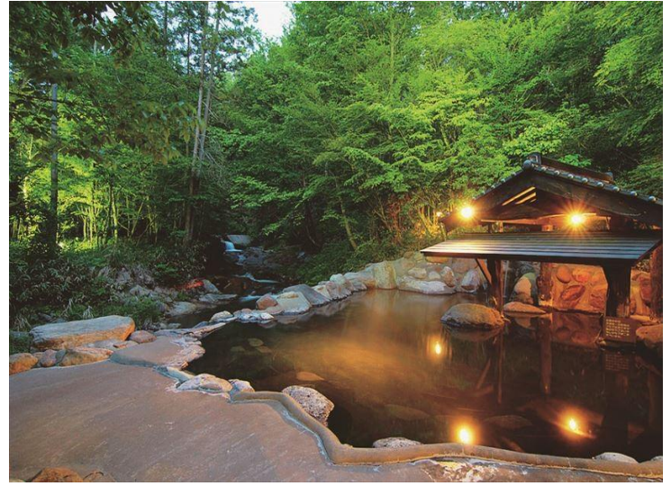
黑川溫泉~秘湯巡禮