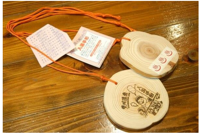
溫泉手形泡湯體驗樂趣