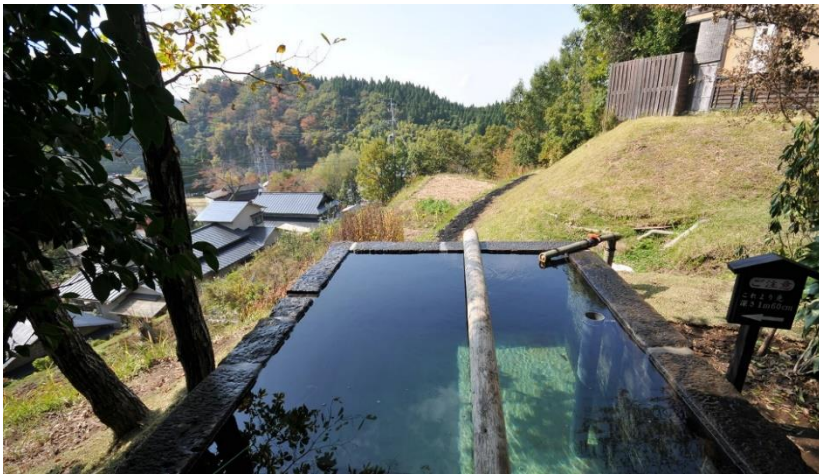
日本第一深度最深的溫泉立湯 162cm