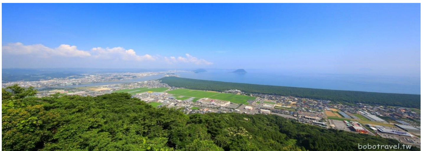
日本三大松園~虹之松原