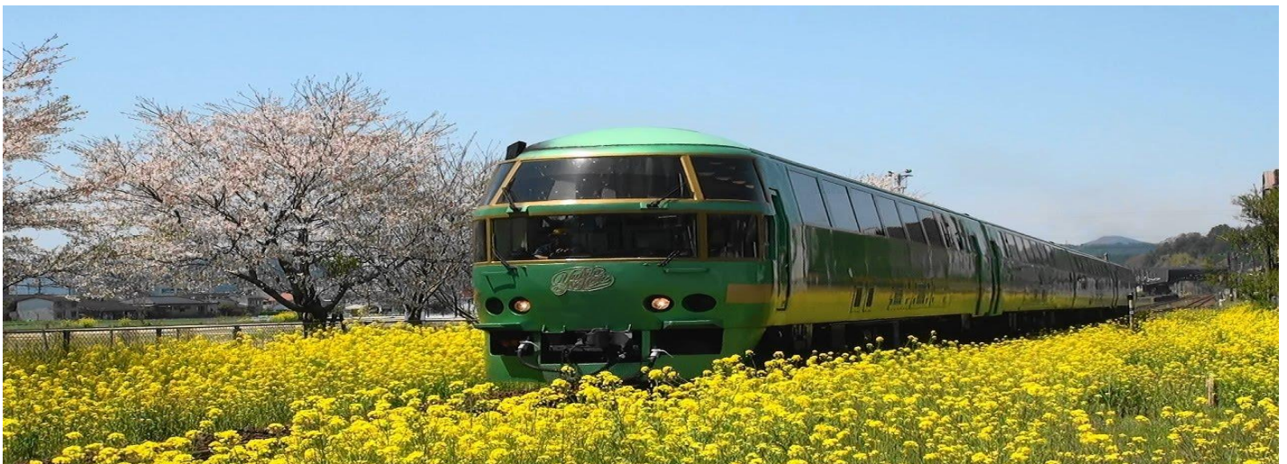
只為你停留~ 由布院之森特快車