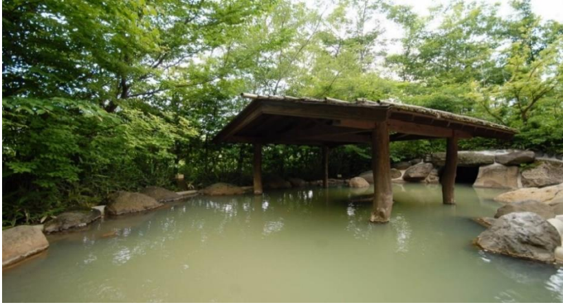
充滿芬多精的露天溫泉