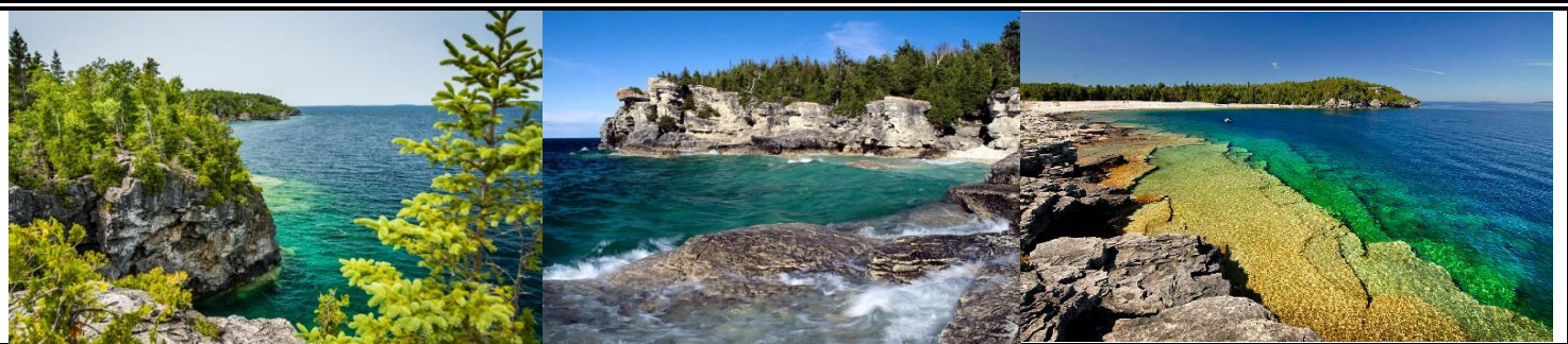
布魯斯半島公園—喬治亞灣步道