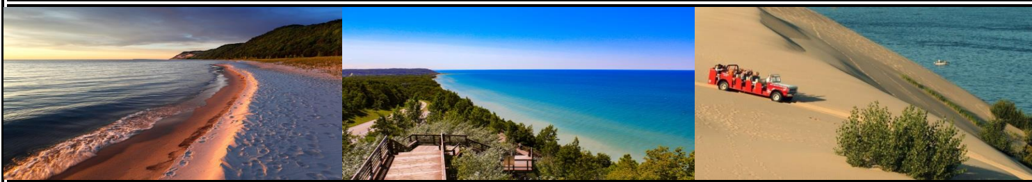
睡熊沙丘國家公園