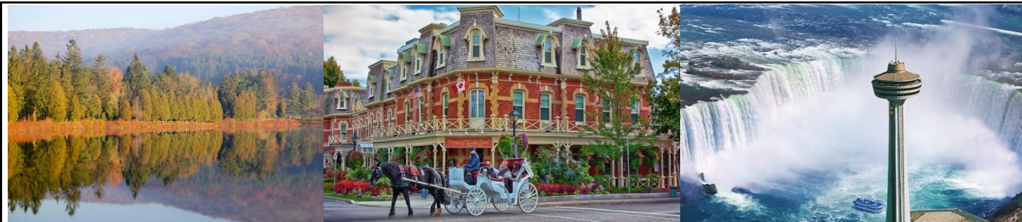
阿勒格尼州立公園