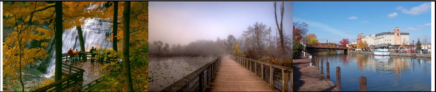
布蘭迪萬瀑布小徑